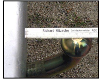
Abstand vom KK zur Stoßstange