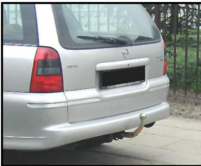
Fahrzeug mit AHK von der Seite