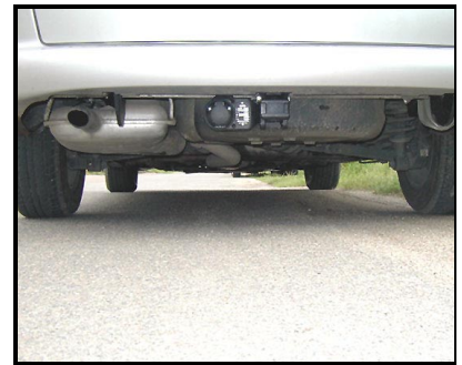
Fahrzeug ohne KK

Beiträge zur Erweiterung bzw. Vervollständigung unserer Informations- bzw. Bilddatenbank honorieren wir mit bis zu 50 Euro. Sollten Sie Interesse haben, setzen Sie sich bitte per E-Mail mit Herrn Greiner unter d.greiner@kupplung.de in Verbindung.