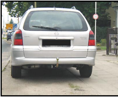
Fahrzeug mit AHK