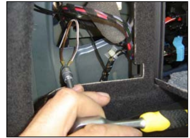
Masseverbindung an Fahrzeugkarosserie anschrauben