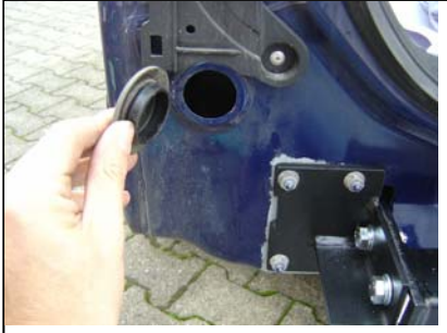
Auf linker Seite Gummiabdeckung abnehmen