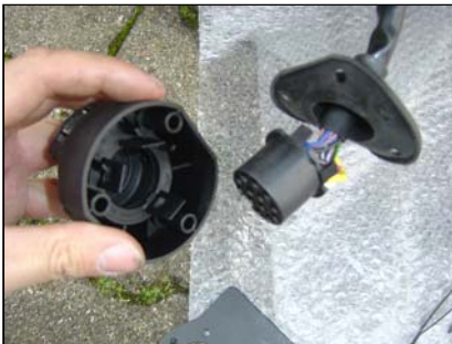
Steckdoseneinsatz in Gehäuse montieren