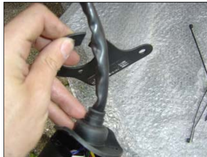
Steckdose an Steckdosenhalter montieren