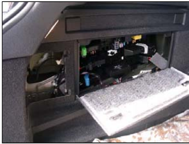
Abdeckklappe hinten links öffnen