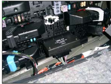
Modul auf den freien 14-fach Steckplatz aufstecken