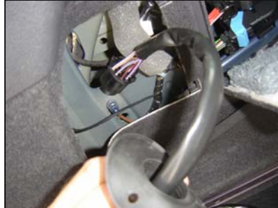
Kabel von innen nach außen durchführen