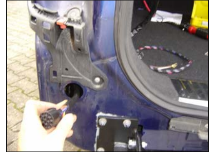
Kabel von innen nach außen durchführen